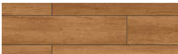
KT404 CARVALHO PETRA