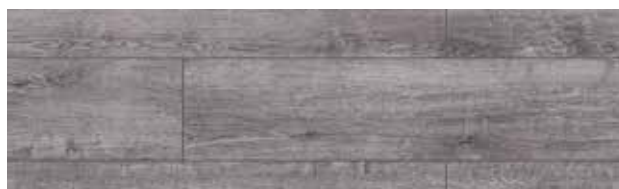
KT408 CARVALHO CAMPUS