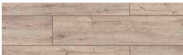
KT403 CARVALHO BENFICA