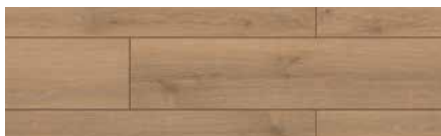
KT405 CARVALHO CANYON