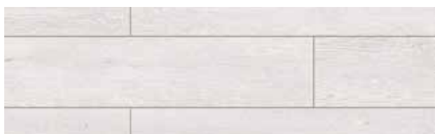
KT400 CARVALHO EDISON